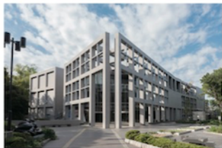
JR 京浜東北線北浦和駅西口より徒歩3分(北浦和公園内) JR 東京駅、新宿駅から北浦和駅まで、それぞれ約35分

繋がるをテーマにしたでこぼこアート教室 2018年の特別企画第二弾は、浦和にある埼玉県立近代美術館を訪れ、有名なアーティストの作品と触れる体験をします。美術館や美術作品はどのようなものなのか学芸員の方のお話を伺います。また、常設展での学芸員の方とのやり取りを通して鑑賞の仕方を体験します。(絵画以外にも、美術館の建物自体、有名デザイナーによる面白い形の椅子のコレクション、野外彫刻など見るべきものがたくさんあります。)でこぼこアート教室でも作品の制作後、鑑賞会を行います。他の人の作品に興味を持って鑑賞することの楽しさをあらためて体験したいと思います。